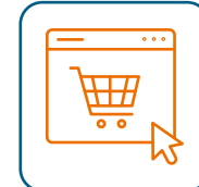
Comerç en línia