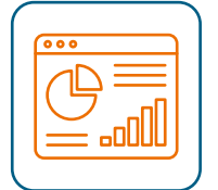
Visualización de datos