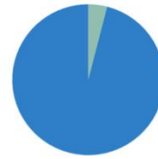
Distribución por sectores

11.961 empresas en Catalunya en el año 2014. El 96% se dedican a los servicios.