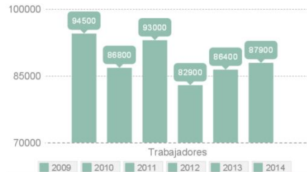
Número de trabajadores

El empleo ha crecido un 6% desde 2012. Las empresas internacionalizadas son las que contratan más y necesitan perfiles especializados para trabajar en proyectos concretos.