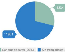
Tamaño de empresas