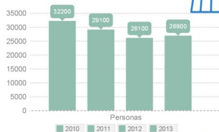
Empleo sector (CAT)

En el año 2014 se frenó la caída del empleo e, incluso, se crearon nuevos puestos de trabajo. Esta mejoría en el empleo se dio especialmente en el subsector de confección de ropa (moda).