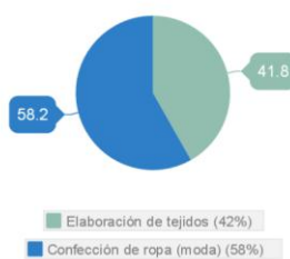
Distribución según producto

El número de empresas se ha reducido a lo largo de los últimos años y el tamaño más habitual de empresa está entre 0 y 9 trabajadores. Las empresas que se dedican a la producción de tejidos son de tamaño mayor que las que se dedican a la confección de ropa de vestir.