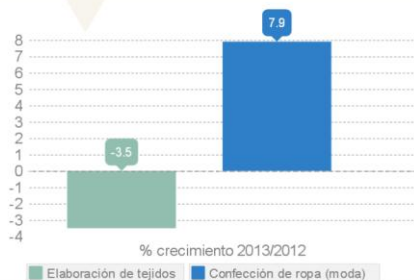
Tasa de empleo (CAT)