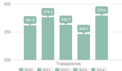
Número de trabajadores (millares)

Es uno de los sectores que genera más empleo, del cual el 76,6% es vía contrato laboral. El subsector de servicios de comida y bebida es el que genera mayor empleo. El tamaño promedio de las empresas del sector está entre 1 y 9 trabajadores.