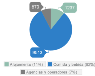
Distribución por actividad

El sector muestra un número estable e importante de empresas en Barcelona, especialmente centradas en la restauración.