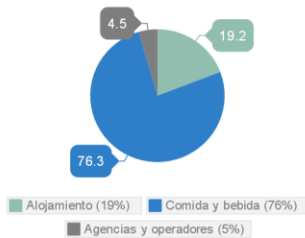
Empleo según actividad